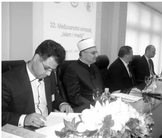
Svečano otvorenje Međunarodnog simpozija "Islam i mediji"