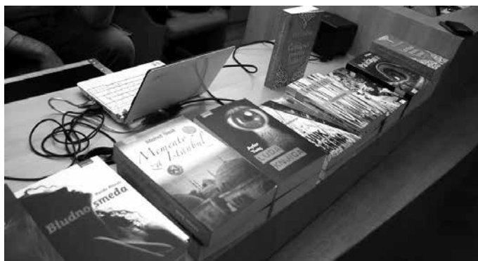
Predstavljanje knjiga turskih književnika objavljenih na hrvatskom jeziku