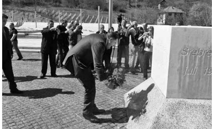
Milorad Dodik u Memorijalnom centru "Srebrenica - Potočari" (politički inženjering pred fotoreporterima)

Istoga dana kada je posjetio Srebrenicu i Potočare, zanimljivo je da je Dodik u Skupštinu RS-a uputio prijedlog rezolucije o priznava- nju genocida nad Armencima. Zar nije više nego očigledno da je Do- dikova posjeta Potočarima dobro isplanirani poduhvat u cilju politič- kog inženjeringa kako bi se pripremio osnov za vođenje meke i tvrde politike na pragmatična način kojom bi se političko i socijalno tkivo bosanskih muslimana duboko podijelilo. Jasno je da vlasti RS-a ne žele otvoreno prihvatiti da se u Srebrenici desio genocid jer bi time implicitno potvrdili da je i taj entitet stvoren na genocidu i ubijanju. U RS-u je mali broj političara i građana, ako ih uopšte i ima, koji su spremni da priznaju tu historijsku činjenicu i na tim osnovama grade suživot i pomirenje. Iako je prošlo 20 godina od tog krvavog događa- ja koji je obilježio evropsku historiju 20. stoljeća, još nijedan srpski političar u RS-u nije jasno priznao genocid u Srebrenici.