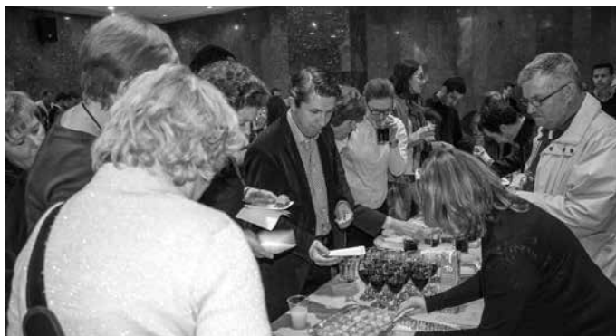
“Turkish delights party” - degustacija turskih jela

žan je 22. travnja, u Clubu 100. Tijekom tradicionalnog ugodnog druženja uz Turkish delights party gosti su uživali u degustaciji turskih jela kao što su baklava, kebab i rahat lokum te najbolje turske kave na svijetu “Kurukahveci Mehmet Efendi”. Za glazbeni dio bio je zadužen DJ Deniz Kaya, a nastupila je i skupina plesačica orijentalnog plesa “Seherezade Oriental Dances”.