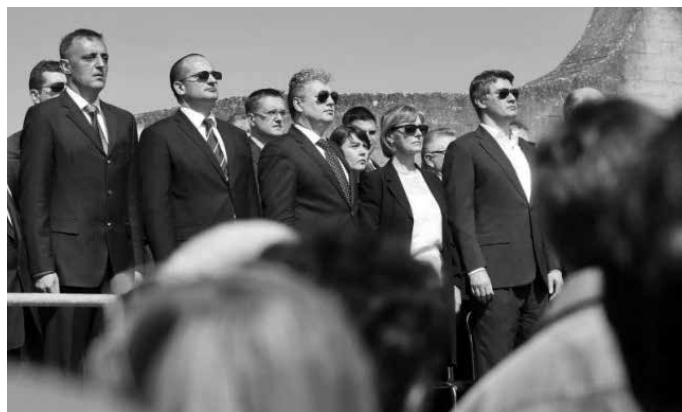
Državni vrh RH na komemoraciji u Jasenovcu (osim predsjednice Kolinde Grabar Kitarović)