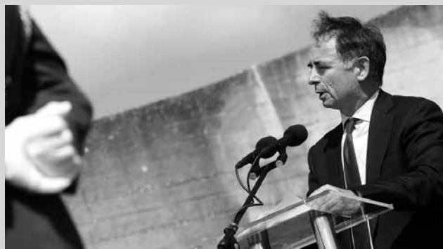
Milorad Pupovac u Jasenovcu

Prije 70 godina zatočeni ustaškog koncentracijskog logora smrti krenuli su u proboj. Nisu čekali oslobođioce, već su odlučili da se pridruže snagama slobode. Bivali su između neizvjesne slobode i mnogo izvjesnije smrti. Prije 70 godina ujedinjena antifašistička Evropa pobijedila je nacistički režim i njegove kvislinške režime, poput ustaškog. Tada su Evropljani znali što je nacifašizam. Danas i ovdje, nakon 70 godina, zbog onih 600 koji su krenuli u proboj i zbog onih dosad popisanih gotovo 100.000 žrtava trebamo postaviti pitanje: znamo li to mi današnji i ovdašnji što je nacifašizam. Znamo li ga prepoznati i znamo li mu kad treba reći "ne".