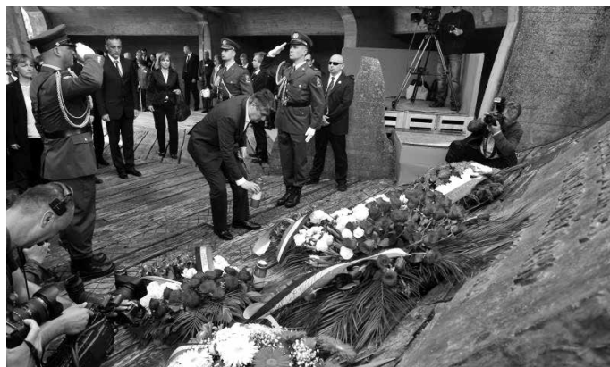
Premijer Zoran Milanović polaže vijenac na spomen-obilježju u Jasenovcu