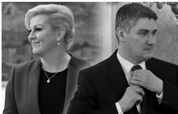
Kolinda Grabar Kitarović i Zoran Milanović (nama ljubavi između Kolinde i Zokija)

Predsjednik Hrvatskoga sabora i Glavnog odbora SDP-a Josip Leko zamjerio je predsjednici Grabar Kitarović da nije naznačila što je konkretan cilj sastanka na Pantovčaku i što se njime želi postići. Najave da Milanović neće ići na Pantovčak komentirala je predsjednica Republike izjavivši da Milanoviću treba "dati šansu da se urazumi". Predsjednik Hrvatskog sabora je rekao da na sastanak s Grabar Kitarović iz SDP-a ne bi smio ići nitko drugi osim predsjednika stranke. "Ako ide, ide predsjednik stranke. On predstavlja i zastupa stranku i