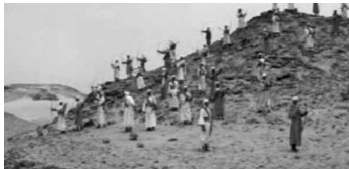
Scena iz filma "Pod zastavom Muhammeda, a.s." prikazuje muslimansku vojsku (streličare) u Bitci na Uhudu

Muhammed, a.s., je osobno osmislio strategiju za Bitku na Uhudu. Ključni su bili streličari, njih pedesetak, koji su morali štiti muslimanskoj vojsci leđa od dobro naoružane i uvježbane mekanske konjice, dok su se muslimanski pješaci i konjanici imali suočiti s neprijateljem licem u lice u podnožju planine Uhud. Poslanik je streličarima strogo podcrtao da ni ukolem slučaju ne smiju napu-