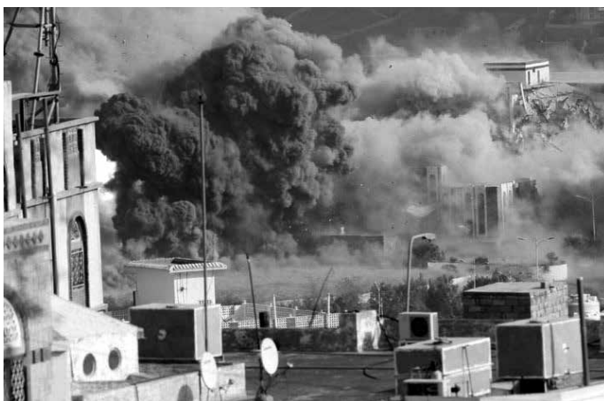
Saudijska Arabija temeljito uništava infrastrukturu najsiriromašnije arapske zemlje