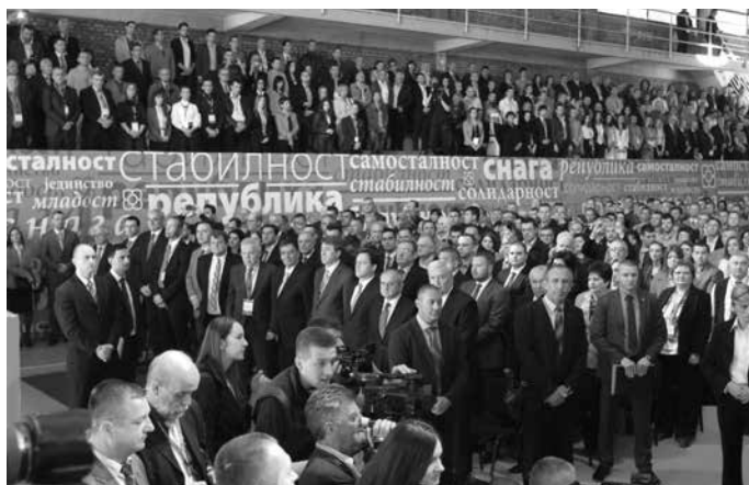
5. Sabor SNSD-a u tzv. Istočnom Sarajevu

Deklaracija usvojena na Saboru nosi naziv "Republika Srpska - slobodna i samostalna", a zamjera višegodišnje prenošenje nadležnosti sa entiteta na državu Bosnu i Hercegovinu. Uz to, deklaracija pojašnjava: "Na osnovu rezultata referenduma, organi vlasti RS predložiti će drugom entitetu FBiH mirno razdruživanje i obostrano priznanje; na prostoru BiH, od tada samostalnih država formira se Unija država BiH, sa otvorenim granicama, slobodnim kretanjem ljudi i roba; nakon samostalnog statusa, RS bez odlaganja traži pristupanje Evropskoj uniji uz prihvatanje njenih pravnih tekovina." Iako bošnjački političari nisu previše ozbiljno shvatili, a skoro nikako reagovali na ove prijetnje o secesiji, Deklaracija je na neki način plan o izgradnji nezavisne države RS-a u budućnosti, što bi se moglo i desiti ako to odobre velike globalne sile, poput SAD-a, Rusije i Evropske unije.