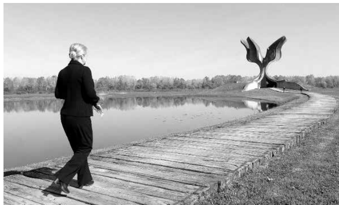
Predsjednica Kolinda Grabar Kitarović polutajno u Jasenovcu

Možda je najsretniji tih dana bio zagrebački gradonačelnik Milan Bandić, najvažniji akter u USKOK-ovoj istrazi "Agram". On ponovo može obavljati gradonačelničku dužnost. Naime, Izvanraspravno vijeće Županijskog suda u Zagrebu djelomično je prihvatilo njegovu žalbu na rješenje suca istrage kojim je odbio prijedlog obrane da mu se ukinu izrečene mjere opreza. Tako i dalje egzistira mjera zabrane uspostavljanja ili održavanja veze sa svjedocima koji još nisu ispitani u istrazi, dok je istovremeno ukinuta zabrana obavljanja profesionalne djelatnosti gradonačelnika Grada Zagreba. Pritom ostaje na snazi