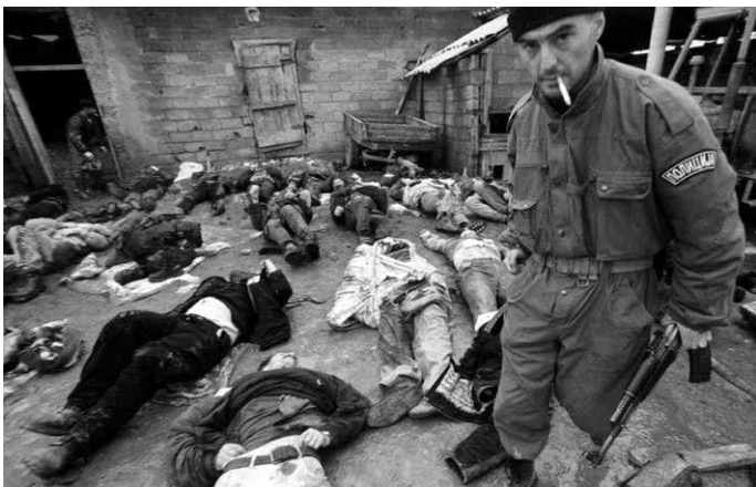
Zvornik, lipanj 1992. (srpski policajci i ubijeni Bošnjaci)

Osim toga, nakon napada u Zvorniku, na desetine Bošnjaka u gradovima koji se nalaze u RS-u su bili privođeni samo zato što su muslimani i što imaju bradu i Kur'an u svojim domovima. Ovim su strukture vlasti u RS-u pokazale strateško djelovanje u cilju zastrašivanja i etničkog istrebljenja preostalih Bošnjaka u tom entitetu koji bi se narednih godina zaista mogao odvojiti od BiH jer već sada u njemu Srbi čine više od 90% populacije. Osim toga, vlastima u RS-u već sada je uspjelo da pošalju sliku u svijet o opasnim i radikalnim bosanskim muslimanima koji predstavljaju terorističku prijetnju za Srbe na Balkanu, ali i za cijelu Evropu. Eto zašto je napad u Zvorniku označen terorističkim bez prethodno provedene istrage! □