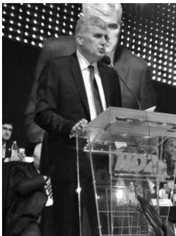
Dragan Čović (HDZ BiH)

Ni dosadašnji predsjednik Dragan Čović nije imao protukandidata na 12. Saboru Hrvatske demokratske zajednice BiH održanom u Mostaru. Preko 500 delegata jednoglasno su ga izabrali, čime je zaključena farsa izbora stranačkih predsjednika tog travanjskog dana. Čović se, kao i ostali HDZ-ovci, deklarativno zauzeo za državu BiH, ali po njihovoj mjeri. Podnoseći izvještaj o radu između dva Sabora HDZ-a BiH, Čović je uz ostalo poručio kako euro-atlantski put BiH nema alternativu. "Nema unutarnjih podjela u BiH. Traženje apsolutne jednakopravnosti sa bošnjačkim i srpskim narodom nije nikakvo novo crtanje karata, kako to neki žele prikazati, kada im tako nešto odgovara", pojasnio je Čović. No nije pojasnio na temelju čega se ne bi crtale nove karte ako se uporno insistira na formiranju trećeg, tzv. hrvatskog entiteta, što je praktično zagovaranje obnove kvilinske zločinačke paradržavne tvorevine tzv. "herceg-bosne".