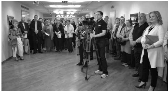
Otvorenje izložbe “Odrazi” istanbulskog fotografa Sultana Selima Kira

Završni program manifestacije Dani turske kulture naziva “Turkish delights party večer turske glazbe, kave i gastronomije” odr-