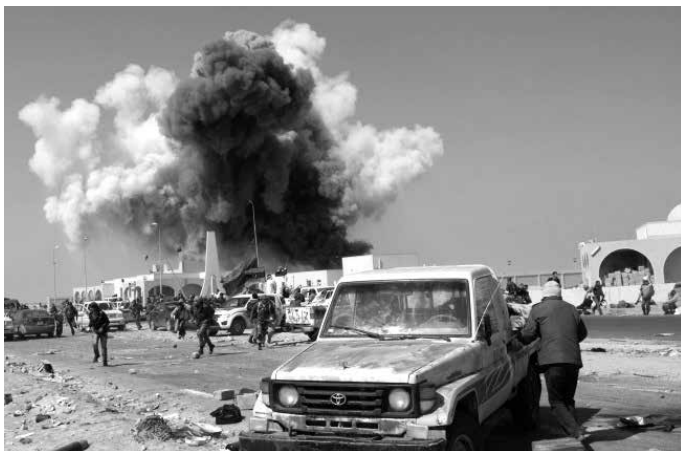
Libijska svakodnevnica (bombaški napad u Bengaziju)

Bit će vrlo zanimljivo vidjeti kako će se Zapad sada postaviti prema libijskim vlastima iz Tobruka i hoće li je se uopće još dugo nazivati “međunarodno priznatom”.