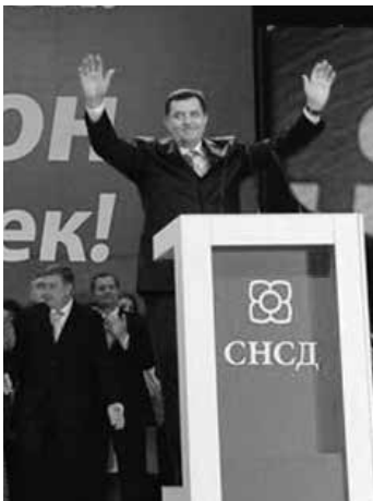
Milorad Dodik (SNSD)

Tako je novi/stari predsjednik SNSD-a Milorad Dodik kojem su svoj glas dali svi delegati, njih preko 800. On je po završetku Petog sabora ove stranke održanog u Istočnom Sarajevu rekao da će tzv. “rs” 2018. raspisati referendum o samostalnosti ukoliko se tom entitetu do tada ne vrate nadležnosti koje su propisane Daytonskim mirovnim sporazumom i Ustavom BiH. “Mi ne dovodimo u pitanje ovlaštenja definisana Ustavom BiH, sporno samo ono što se ne nala-