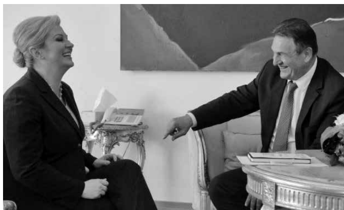
Kolinda Grabar Kitarović i Radimir Čačić

I zaista, niti Milanović niti bilo tko drugi iz SDP-a nisu se pojavili u zakazanom terminu na Pantovčaku. Kolinda Grabar Kitarović bilo je vidno ljuta te se obratila medijima napavši premijera. pomalo pretjerano ocijenila je kako je on svojim nedolaskom na sastanak u pitanje doveo državne institucije i volju građana te mu poručila da interese države stavi ispred osobnih. "Ovakvo postupanje predsjednika Vlade u normalnim civiliziranim državama, da se uopće ne odaziva pozivu