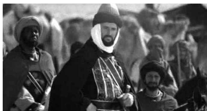
Scene iz filma "Pod zastavom Muhammeda, a.s." prikazuju Halida ibn Velida u Bitci na Uhudu

me tko kaže da je Poslanik umro. No, Allah, dž.š., je nakon Bitke na Uhudu objavio: "Muhammed je samo poslanik, a i prije njega je bilo poslanika. Ako bi on umro ili ubijen bio, zar biste se stopama svojim vratili? Onaj tko se stopama svojim vrati neće Allahu nimalo nauditi, a Allah će zahvalne sigurno nagraditi." (Ali-Imran, 144)