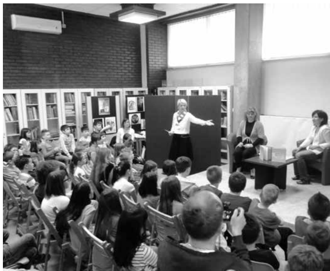
"Baula moga djetinjstva" u Sisku

"Krenulo je od misli i ideje preko riječi do izvedenog djela. Prihvativši izazov krenula je suradnja u kojoj su se našle četiri kreativke. Kako slučajnosti ne postoje, već se sve događa s dobrim razlogom tako se i ovaj pionirski projekt pokrenuo i polučio vidljive rezultate. Osobno sam uvjeren da je samo jedan u nizu ostalih koji predstoje, bilo da je riječ o zajedničkom ili individualnom. Nepresušno vrelo prirode i kulture življenja daje nam prilike i prostor za izgradnju kvalitetnih sadržaja koji su od posebne važnosti u izgradnji generacija koje dolaze. Značajna motivacija u realizaciji slikovni-